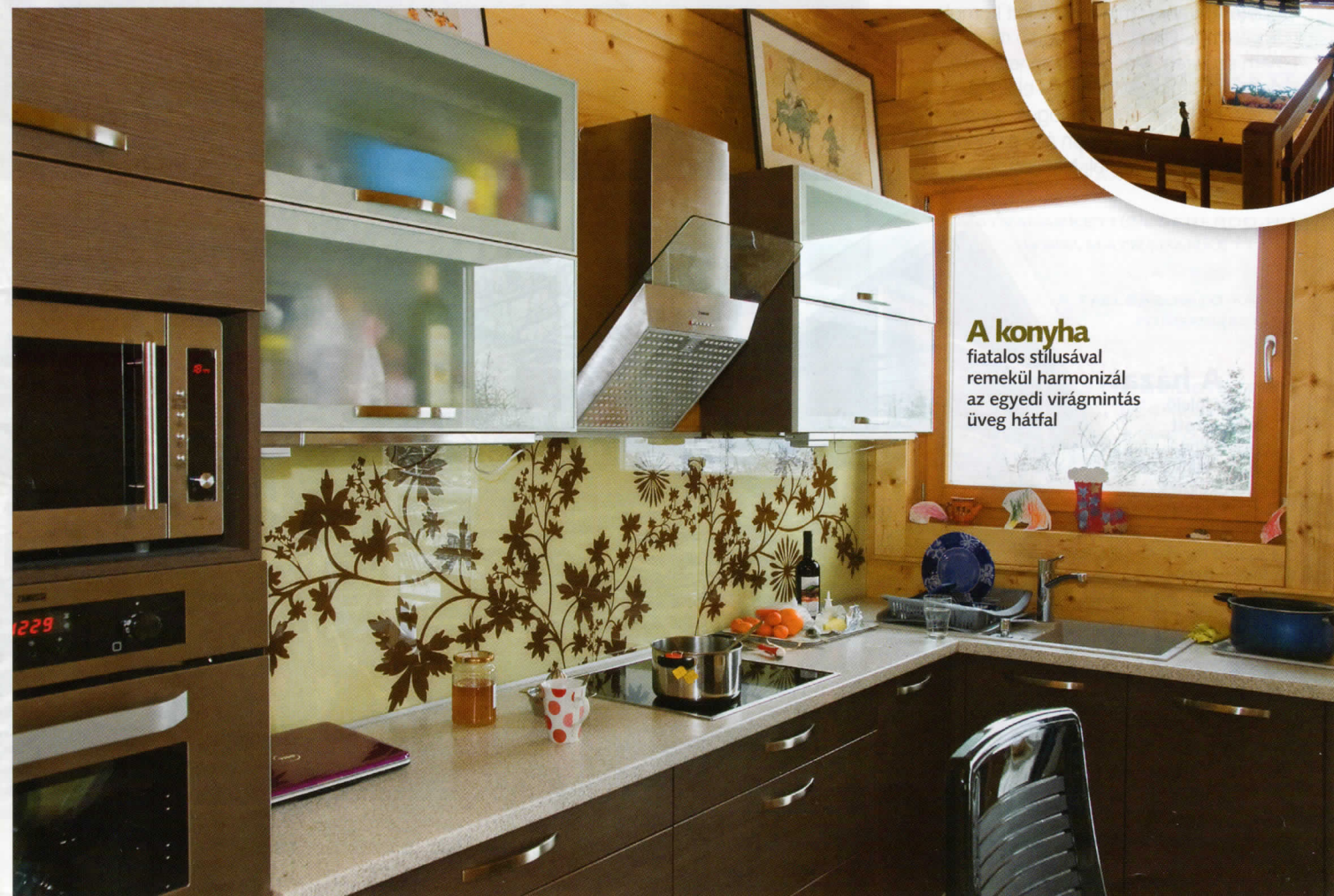
A konyha fiatalos stílusával remekül harmonizál az egyedi virágmintás üveg háttal