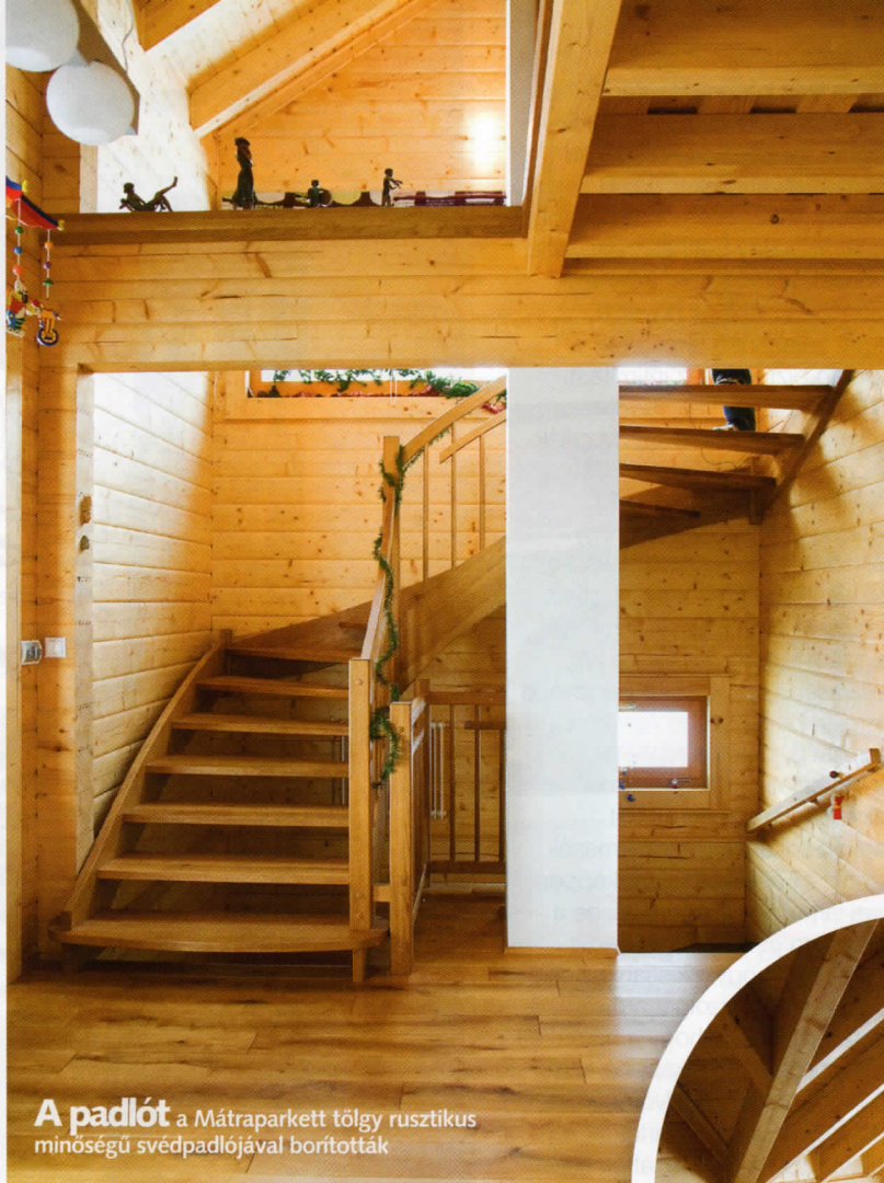
A padlót a Mátraparkett tölgy rusztikus minőségű svédpadlójával borították